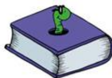
Livre ou magazine en français

4 Fermez avec un élastique (pas de scotch)