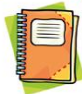
Cahier, papier ou livre de coloriage