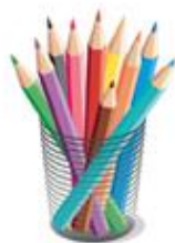
Crayons, stylos ou feutres