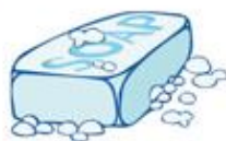
Savon ou gel-douche