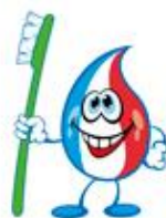
Dentifrice ET brosse à dents