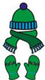
Bonnet et/ou gants ou écharpe d'hiver

3 Remplissez la boîte ou le sac à dos avec TOUS les objets suivants :